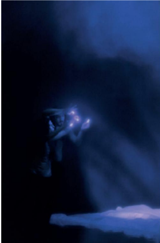
Burnout - 21 juillet 2019 - Festival d'Avignon Théâtre 11.Belleville Gilgamesh

Ces trois années de résidences ont permis à l'équipe de se rapprocher des enjeux de la création "Phénomène" ainsi que de collaborer avec Tristan Bordmann, Marie Denys et Philippe Orivel qui feront partie de l'équipe de création.